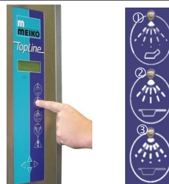
3. Reinigungsprogramm entsprechend der Verschmutzung wählen. Die Programmtaste drücken. Tür schließt und das Programm startet mit dem voreingestellten A 0 -Wert automatisch.