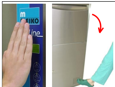
1. Waschkammertür durch Lichtsensor oder Fußtaster öffnen.