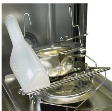
2. Reinigungsgut in der vorgesehenen Position im Gefäßehalter einsetzen.