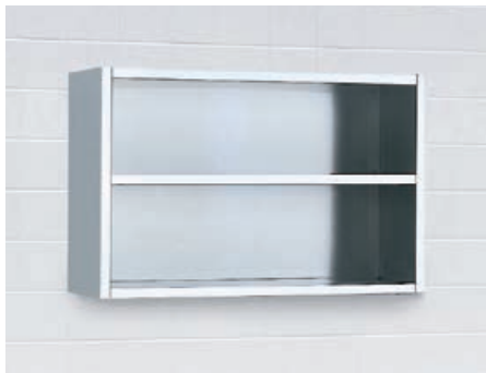
Offene Wandschränke Schränke für die offene Ablage mit jeweils 1 Zwischenboden. In den Breiten 500 mm, 1.000 mm und 1.200 mm.