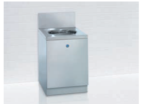
Ausguss* Standardmodell optional mit eingebauter Ausgusspülung, unabhängig vom Steckbeckenspüler bedienbar.

* Abbildungen enthalten Sonderausstattungen ** Optional: Lichtblende und Leuchtmittel