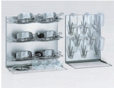
Abtropf- und Lagerregale* für desinfizierte Urinflaschen, Bettpfannen und Gefäße mit Abstellrost oder Abtropfwanne. In den Breiten 500 bis 1.400 mm.

Zusätzlich zur MEIKO Reinigungs- und Desinfektionstechnik halten wir für Sie ein umfangreiches Zubehör- und Einrichtungsprogramm für sicheres und ergonomisches Arbeiten sowie hygienisches Lagern von Pflegeutensilien bereit. Nachstehend 6 Beispiele praxisorientierter Lösungen. Gerne erarbeiten wir auch für Sie individuell geeignete Lösungsvorschläge aus. Sprechen Sie uns an. Wir sind jederzeit und gerne für Sie da.