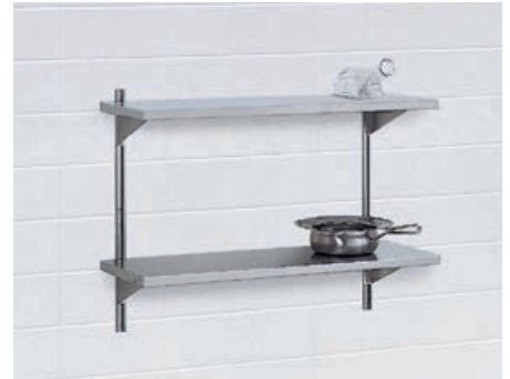
Wandregal* mit höhenverstellbaren Ablagen in allen Breiten (Tiefe 350 mm).