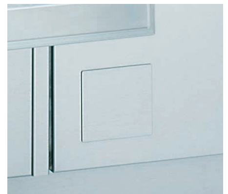
Fußtaster zum Öffnen und Schließen der Gerätetür (optional).