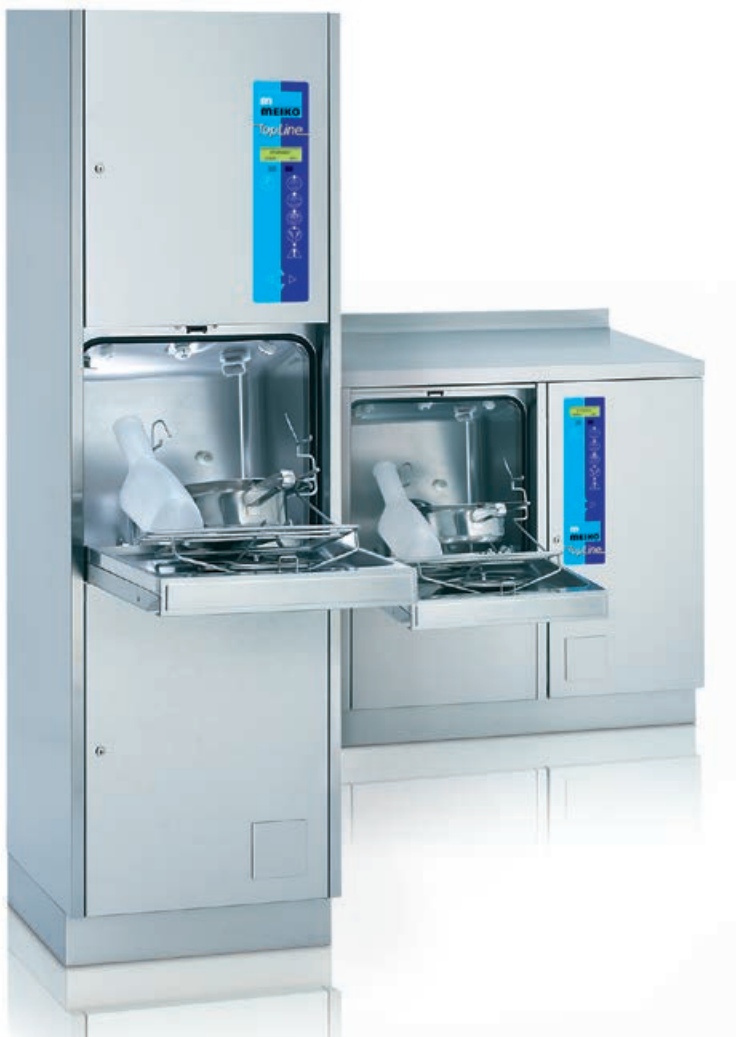
TopLine 20 Standgerät und TopLine 40 Tischmodell, mit automatischer Türöffnung (optional) und Fußtaster (optional).