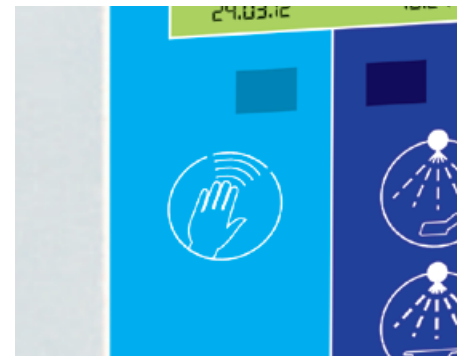
Näherungsschalter zum Öffnen und Schließen der Gerätetür (optional).