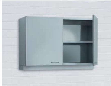
Geschlossene Wandschränke** Schränke mit Schlagtüren und jeweils 1 Zwischenboden. In den Breiten 500 mm, 600 mm, 800 mm, 1.000 mm, 1.200 mm und 1.500 mm.