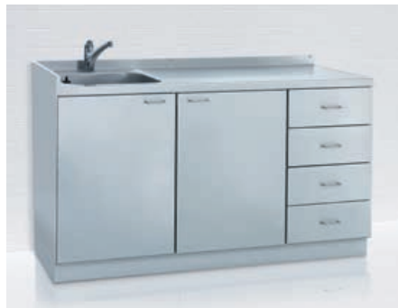
Spülkombination* Unterschränke u.a. mit Schubladen für Pflegekombinationen in unterschiedlichen Breiten und Höhen planbar.